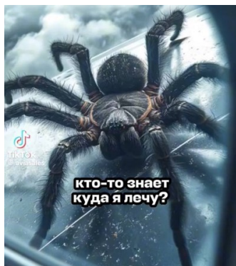
Рис. 2. Пример мем-контента в коммуникации бренда Aviasales в TikTok [скриншот] / @aviasales. — TikTok, 17.01.2026. — URL: https://vt.tiktok.com/ZSu1KGpAn/ (дата обращения: 11.01.2026).

Исследование MGPU Media «Креолизованная реклама через призму интернет-мемов» (2025) на основе анализа более 100 постов сервиса выявляет лингвистические приемы, обеспечивающие эффективность мемов в продвижении: поликодовость, интертекстуальность, игровая трансформация языковых единиц [15].